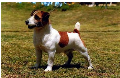
ПРОМЕЖУТОЧНАЯ РАЗНОВИДНОСТЬ (БРОУКЕН - ШЕРСТЬ СМЕШАННОГО ТИПА С ИЗЛОМОМ)