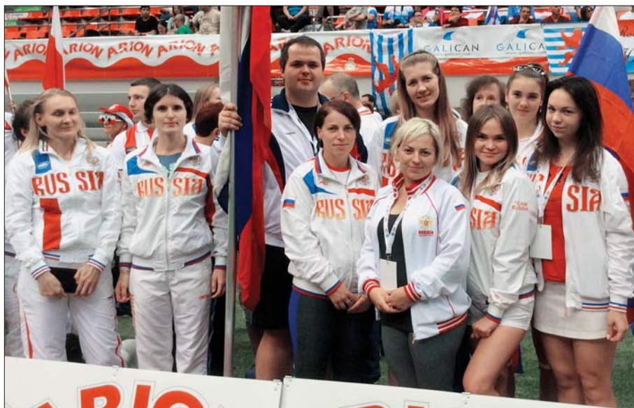
Сборная РКФ по аджилити

Соревнования начинались в четверг, но участники начали съезжаться уже в среду для регистрации, прохождения ветеринарного контроля и опробования покрытия и снарядов. Кстати, покрытие — искусственная трава — очень огорчило участников тем, что было довольно скользким. Это особенно сильно сказывалось на движениях собак категории «макси», где выступают в основном бордер колли и бельгийские овчарки. Плохое покрытие для собак, показывающих на трассе скорость 5—6 метров