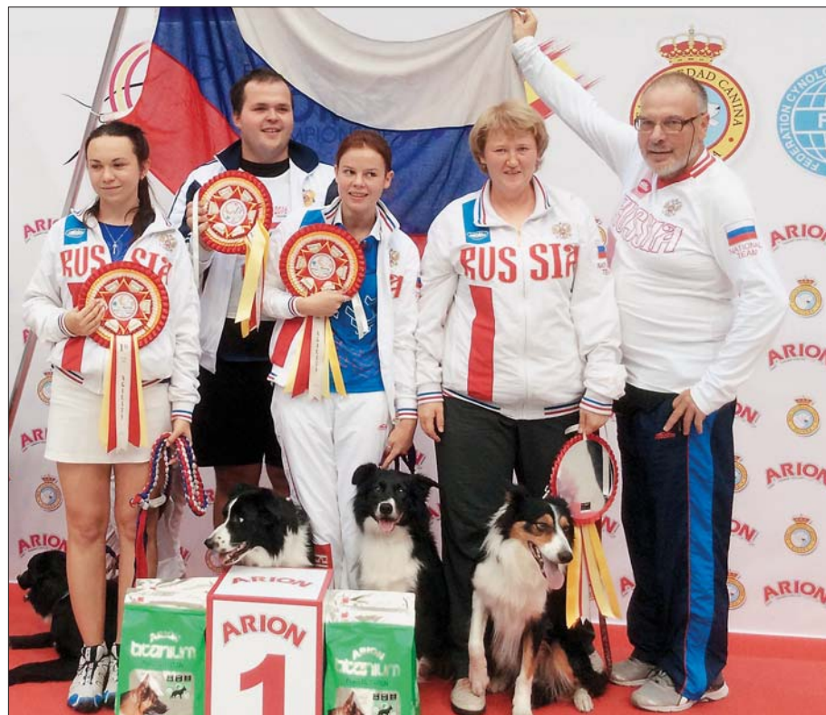
На фото сверху: награждение команд в категории «макси», слева: победители в категории «макси»

В пятницу решалась судьба двух «больших» пьедесталов — две трассы командного зачета категории «мини» и вторая трасса категории «макси». В свою очередь командам категории «миди» предстояло бежать свою первую трассу — джампинг. Утро началось с джампинга «мини-ков». Количество болельщиков на трибунах огромного спортивного комплекса Pabellon Principe Felipe стремительно увеличивалось. Неповторимую атмосферу спортивного праздника создавали болельщики сборных. Особенно шумными и дружными в этом году были французы, норвежцы, финны и, конечно,