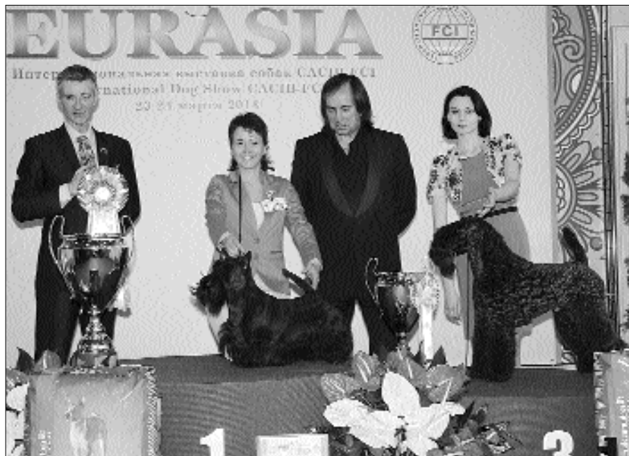
Победители 3-й группы выставки «Евразия-2» (судья Paul Stanton, Sweden): 1-е место — скотч терьер MCVAN'S TO RUSSIA WITH LOVE (вл. М. Хенкина), 2-е место — американский стаффордширский терьер DEAL KING OF RING'S (вл. Т. Волкова), 3-е место — керри блю терьер EDBRIOS ROCK ME AMADEUS (вл. Пахомова)

Бессменным организатором и генеральным спонсором выставки «Евразия» выступает Российская кинологическая федерация. Спонсорами РКФ в проведении выставки в 2013 году стали представители брендов Eukanuba («Лучшее, что вы можете купить для своей собаки»), Happy dog («Родина здорового питания с 1968 года»), Pro Plan («Питает и защищает одновременно»), Royal Canin («Лидер в области здорового питания для собак и кошек») и Brit («Профилактика с помощью правильного питания»). На стендах этих именитых спонсоров РКФ в течение двух дней шли беспроигрышные лотереи для владельцев собак, ветеринары предоставляли бесплатные консультации всем желающим, собакам-победителям вручали подарки. На стенде самой РКФ каждый мог получить консультацию профессионального кинолога, а также зарегистрировать участие в следующих международных выставках —