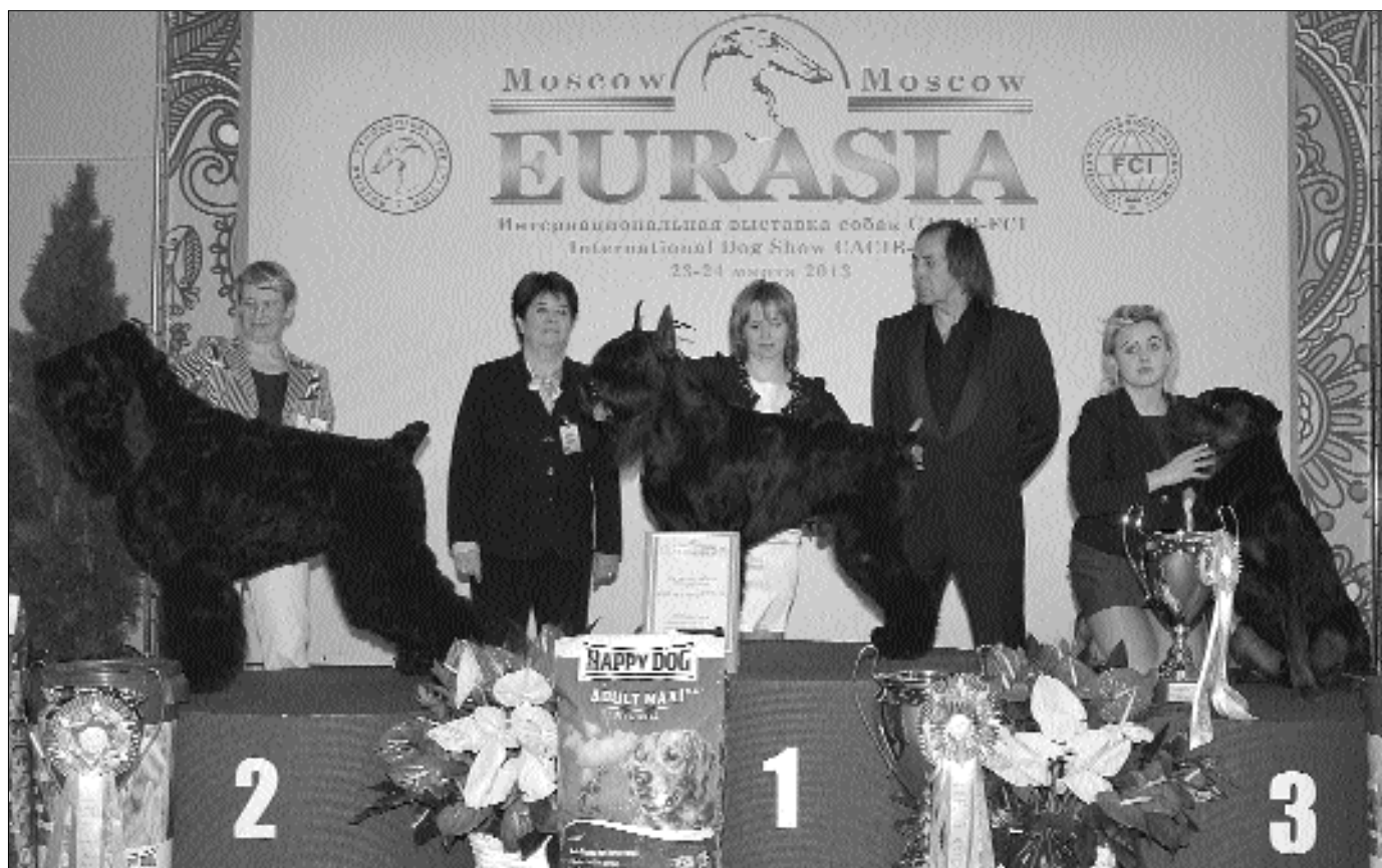
Победители 2-й группы выставки «Евразия-2» (судья Christina Rossier, Switzerland): 1-е место — ризеншнауцер черный GENTLY BORN DOMINGO (вл. А. Власова), 2-е место — русский черный терьер CHERNI RYTSAR IZ RUSSKOI DINASTII (вл. Н. Раппопорт), 3-е место — ротвейлер PRIDVINJE OLAF (вл. О. Беляев)